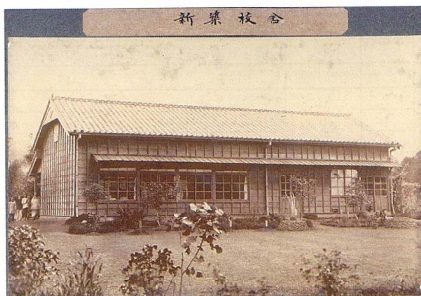
1904 年，北投公學校第一間教室