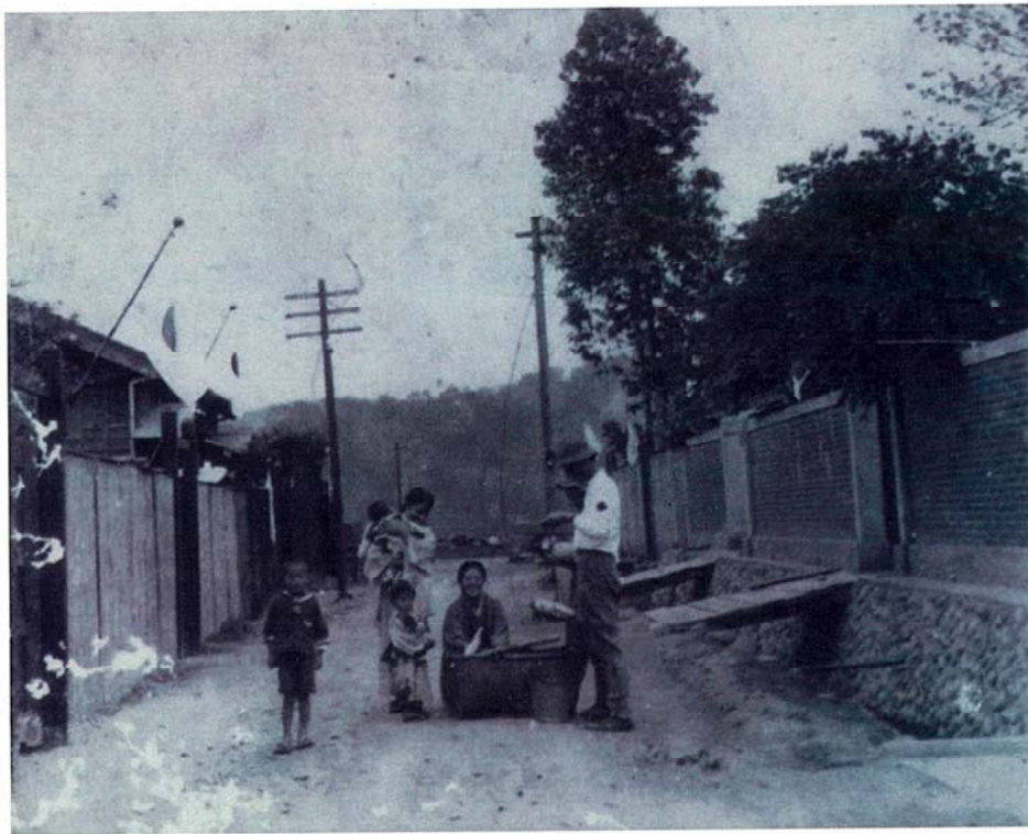
日治時代，北投庄的巷道住家