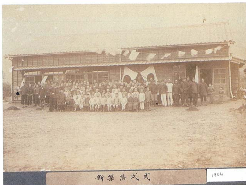
1904 年，新教室落成典禮，許多北投鄉親來祝賀