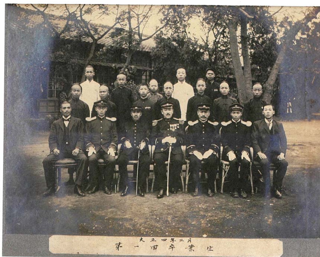
創校早期的教師群