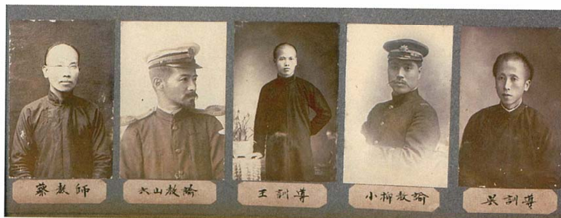
創校早期的教師群