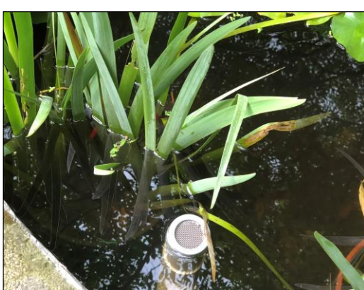
萬生庭旁生態池裡飼養蓋斑鬥魚及孔雀魚，可吃孑孓防治登革熱，防治蚊子的效果，省錢又環保。