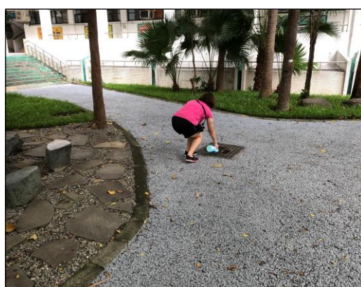
校園陰井處倒漂白水避免蚊蟲產卵。